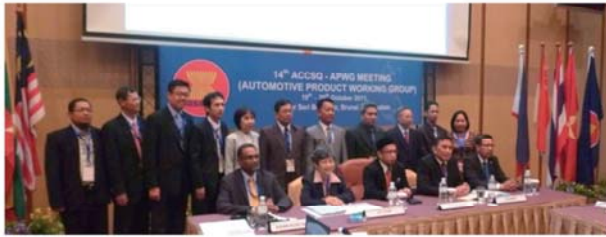
รูปที่ 2 การประชุมผู้แทน ASEAN กลุ่มยานยนต์และชิ้นส่วน