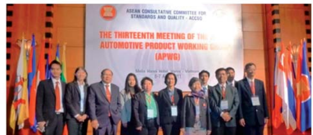
รูปที่ 3 ผู้แทนไทยด้านยานยนต์และชิ้นส่วน

สำหรับสถาบันการศึกษานั้น ต้องปรับหลักสูตรเพื่อรองรับกลุ่ม AEC โดยเฉพาะด้านภาษาอังกฤษ ต้องปรับวิธีการสอนให้ใช้งานได้ พูดได้ ด้านสังคมต้องให้เข้าใจขนบธรรมเนียม ประเพณี อะไรควรและไม่ควรของกลุ่มอาเซียน ด้านศาสนาต้องศึกษาเช่นกัน เช่นวิธีการเข้าโบสถ์ วิธีการละหมาดของศาสนาอิสลาม พิธีการต่างๆ ของศาสนาพุทธ ทางมหายาน รวมทั้งการเข้าสังคมของกลุ่มอาเซียน