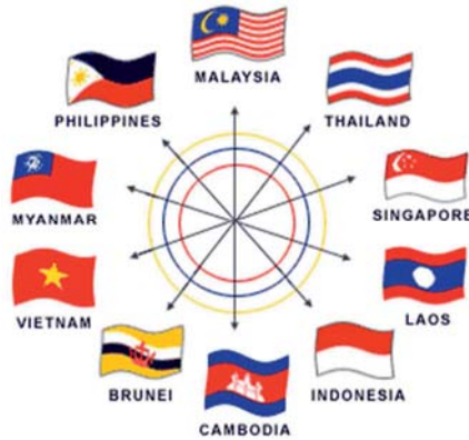
ตารางที่ 3 : การประชุม ACCSQ - APWG MEETING